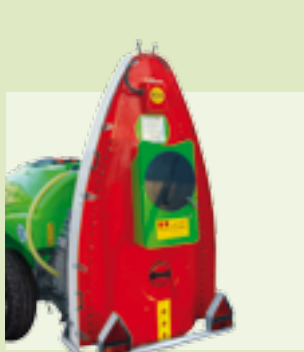
TORRE 32" - 180