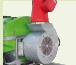
CANNONE 65 S