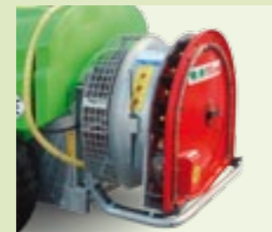
TURBOFAN AA 36"