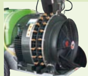
ELICA CONTROROTANTE 32" x 32"