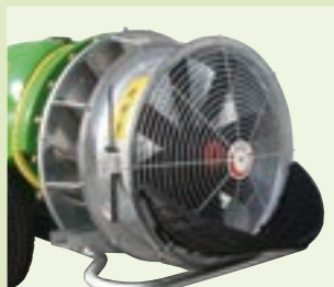
TURBOFAN 36" - 42"

La linea Vector Big monta una completa serie di apparati per ogni tipo di piantagioni e colture. Ligne Vector Big: une complète gamme de souffleries pour n'importe quel type d'Arbres, Vignes et Cultures Basses. Vector Big Line: available with a large range of Spray Fans and Blowers for any type of Trees Plantations and Row Crops.