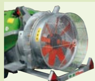
BITURBO 36" - 42"