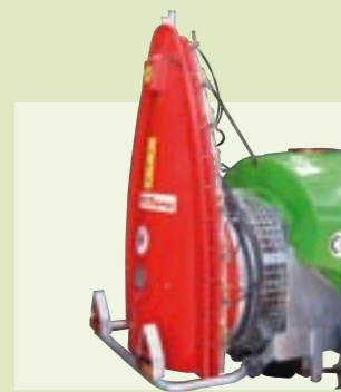
TORRE 36" - 210