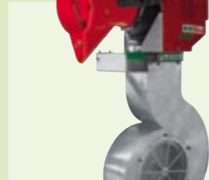
FLEXIGUN 65 S